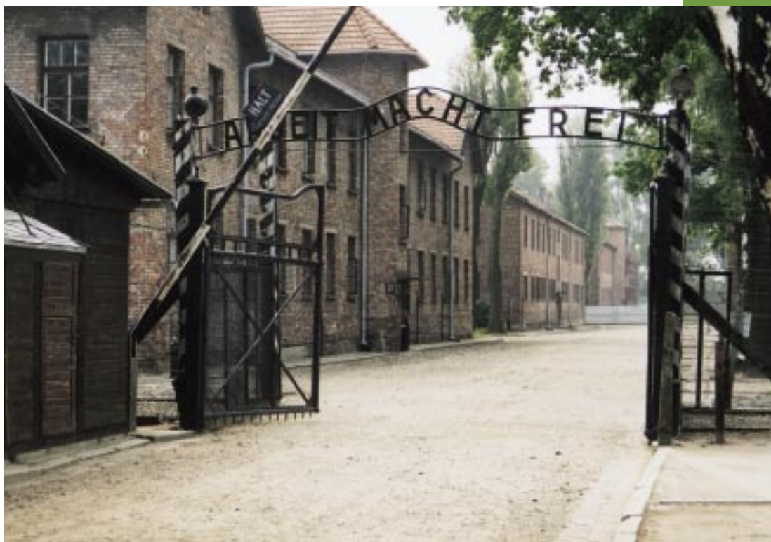
De poort van Auschwitz-Birkenau

Later heeft men op enige afstand Birkenau gebouwd. Dáár heeft de systematische vernietiging van – volgens een ruwe schatting – anderhalf miljoen mensen plaatsgevonden.