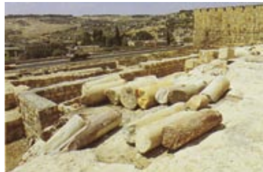
Zuilen verwoeste Tweede Tempel

III:25 Goed is de HERE voor wie Hem verwachten, voor de ziel die Hem zoekt; 26 goed is het, in stilheid te wachten op het heil des HEREN; 27 goed is het voor de man, dat hij een juk in zijn jeugd draagt.