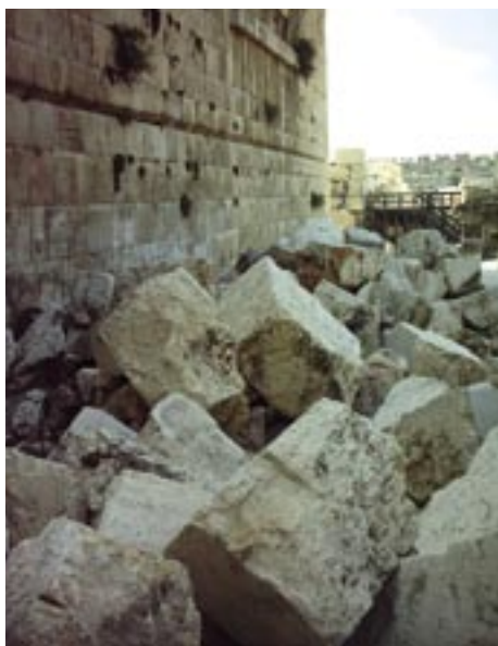
Sporen van verwoesting door Romeinen

Niet alleen de verwoesting van twee tempels, maar ook andere rampen die het Joodse volk in latere tijden troffen worden herdacht. Zoals de verdrijving van de Joden uit Spanje in het jaar 1492 (het decreet daartoe werd uitgevaardigd op precies deze dag). De Joodse traditie voegt er andere gebeurtenissen aan toe, die eenzelfde strekking hebben. Een ervan is de straf van een veertig jaar dierend verblijf in de woestijn, die het volk opgelegd kreeg omdat het naar de angstige verspieters luisterde en het beloofde land niet wilde intrekken. Ze geloofden in de slechte interpretatie van het goede, zoals een Joodse uitlegger deze week zei. De beslissing van God viel op de 9 e Av.