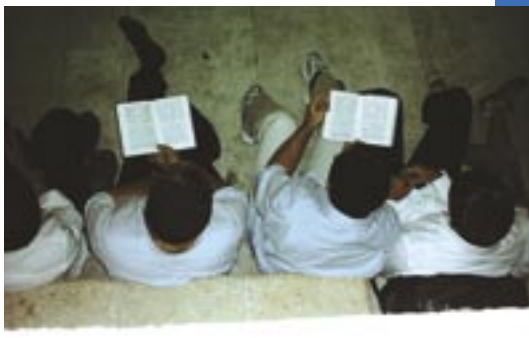
Mannen die Klaagliederen lezen

“Ons erfdeel is overgegaan naar vreemdelingen, onze huizen naar buitenlanders.” (Kl. 5:2) De voorganger van de gemeente onderbrak de lezing en merkte op hoe pijnlijk het is om te zien gebeuren dat Joodse dorpen worden ontruimd en straks in handen van anderen zullen zijn. Tot mijn verrassing voegde hij eraan toe dat we ook objectief naar de situatie moeten kijken. Zelf had hij, vertelde de voorganger, tientallen jaren in een huis in Jeruzalem gewoond, dat tijdens de oorlog van 1948 was verlaten door Arabieren. “Ik heb het nooit hoeven kopen en zelfs nooit huur betaald om erin te wonen”. De pijn van het moment wordt er weliswaar niet minder van, maar wordt wel gerelativeerd.