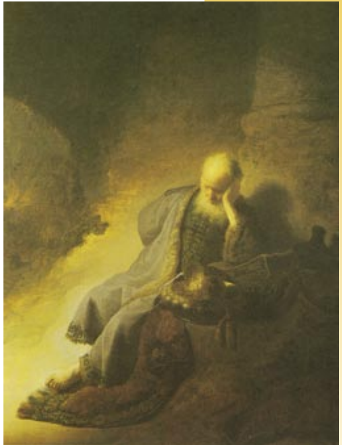
Jeremia weent over de verwoesting van Jeruzalem