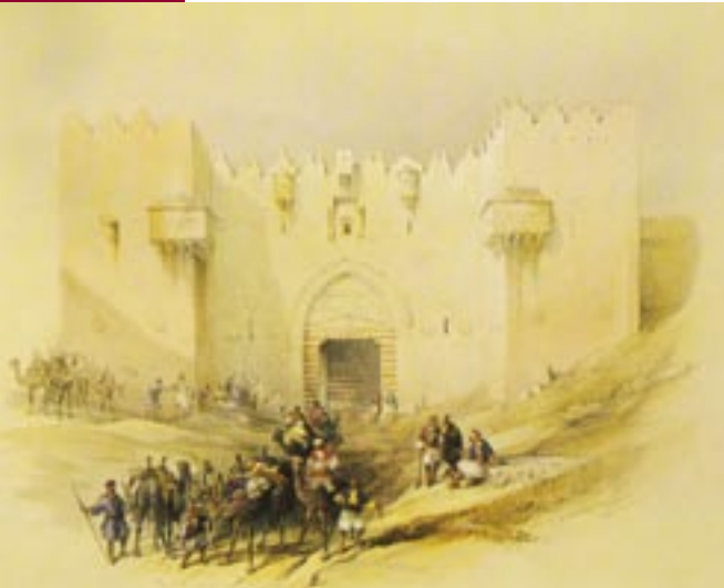
Pelgrims bij de Damascuspoort zoals David Roberts het in 1839 zag

Zolang er christenen zijn, heeft de stad Jeruzalem op hen aantrekkingskracht uitgeoefend. In feite een vreemde aantrekkingskracht, want door Christus' werk was de genade van God niet meer tijd- en plaatsgebonden, maar overal en voor iedere oprechte gelovige toegankelijk. Het zit nu eenmaal in de mens te zoeken naar iets wat tastbaar is.