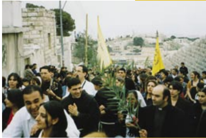
Gelovigen uit de volken gaan op Palmzondag op naar Jeruzalem

En deze belofte van Gods heil in Jezus Messias geldt voor Israël nog altijd