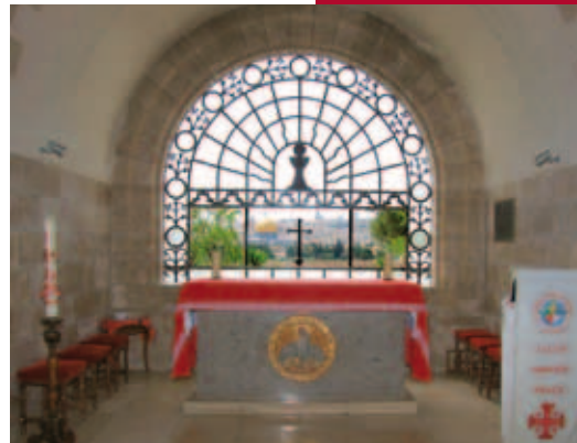
Dominus flevit, de plek waar Jezus weende over Jeruzalem