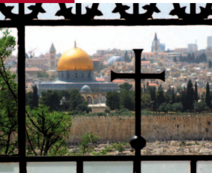
Uitzicht op het tempelplein vanuit Dominus flevit

Kerk en Israël neemt ook de bezinning een belangrijke plaats in. Ik heb er heel veel van mogen leren. Eén van de manieren waarop ik mijn bijdrage leverde was het verzorgen van de website van de deputaten kerk