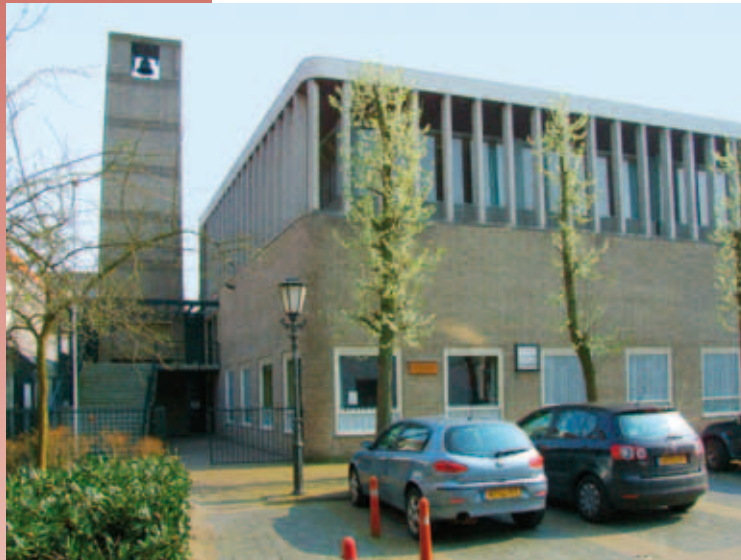
Het kerkgebouw van de Christelijke Gereformeerde kerk van Kampen, de zendende gemeente

ons werk in Jeruzalem is het belangrijk dat we gedragen worden door gebeden. Dat zal vanuit de CGK in Kampen en door allen met wie wij op een andere manier persoonlijke banden hebben, op een directere manier kunnen gebeuren. Maar we hopen dat ook breder, bij het gebed om “Vrede over Israël”, ons werk een plaats zal hebben; bij heel de achterban!