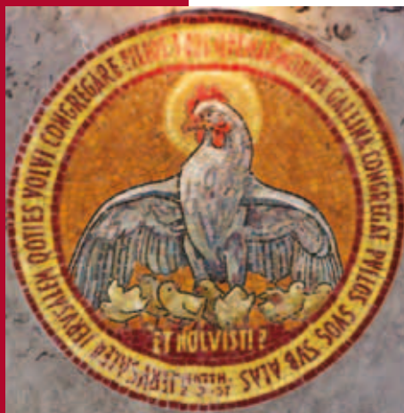
Het symbool op het altaar van Dominus flevit

In mijn werk zal het vooral gaan om luisteren en getuigen