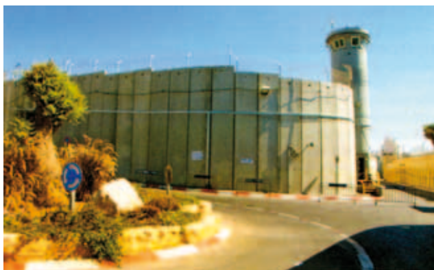
De hoge muur die Betlehem van de Joodse staat scheidt (Een van de vele foto's in het boek)

mening opdringen. Wij dragen de Joodse staat een warm hart toe en steunen de rechtvaardige verlangens van Palestijnen. Maar we willen dat u op basis van wat wij als materiaal aandragen, zelf tot een afgewogen oordeel komt.'