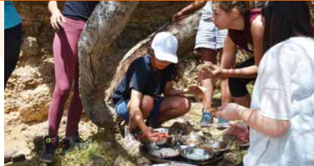
Jongeren eten in de Negev

die, aanbidding en gebed. Zo ontstaat er openheid om levensverhalen en gevoelens van angst en hoop te delen. Er ontstaat een intimiteit die de meeste jongeren niet eerder op zo'n manier hebben ervaren. Jack Munayer, één van de leiding, schrijft: "Het zwaarste onderdeel was de klim naar een oud fort. In dit fort vroegen we de jongeren in volledige stilte op de grond te gaan liggen. We vroegen de jongeren de stilte te gebruiken om naar God te luisteren en na te denken wat verzoening voor hun eigen leven betekent. Daarbij reflecteerden de jongeren op het volgende verhaal: