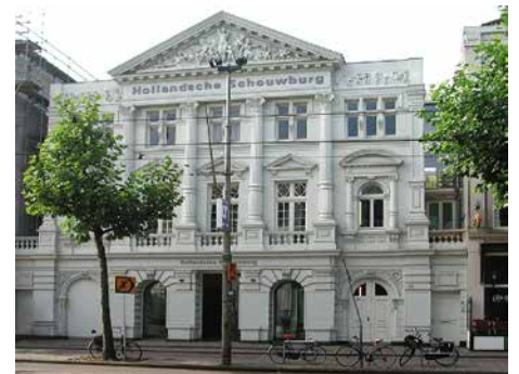
De Hollandse Schouwburg

tussen de school en de schouwburg, en zo het zicht op de school ontnam, werden er snel kinderen in veiligheid gebracht. Daarom beschouwt Cahen deze locatie als een symbool van hoop, redding en moed. Nee, antisemitisme zal voor de komst van de Messias nooit helemaal verdwijnen. Juist daarom moet het antisemitisme tentoongesteld blijven worden, in onderzoeksrapporten en musea. Opdat wij nooit vergeten. Opdat wij altijd gedenken. Dat houdt de hoop levend. <