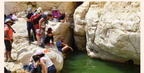
In nationaal park Ein Avdat

Musalaha wil jongeren aanmoedigen een positieve invloed uit te oefenen op hun om-