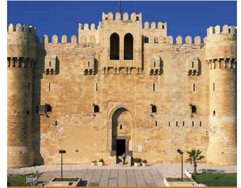
De Osmaanse burcht van Alexandrië

De positieve houding van Origenes t.o.v. de Joden heeft nog met iets anders te ma-