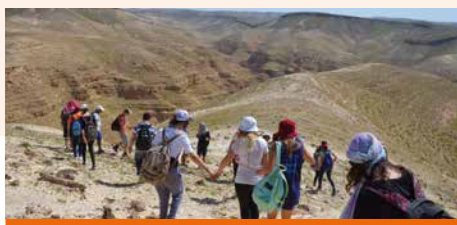
Wandelen in de Negev

Tijdens de woestijnreis wordt veel tijd besteed aan gezamenlijke bijbelstu-