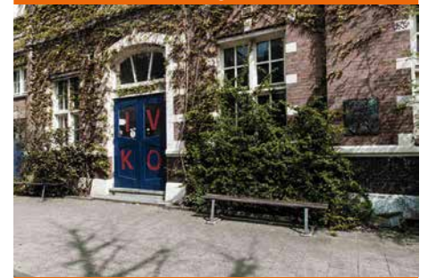
De voormalige Hervormde kweekschool