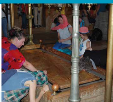
Rooms katholieke en Grieks orthodoxe christenen buigen, knielen, raken aan, kussen

Protestantse pelgrims blijven over-eind staan – in tegenstelling tot bv. Rooms katholieke en Grieks orthodoxe christenen, die buigen, knielen, aanraken, kussen, en kennelijk iets heel bijzonder ervaren op hun heilige plaatsen, waar veel protestantse bezoekers niet zoveel mee hebben. Protestantse pelgrims houden van panorama's, van plekken waar je uitzicht en overzicht hebt – van een afstand, boven alles staand.