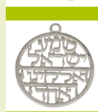
Het Sjema in het Hebreeuws