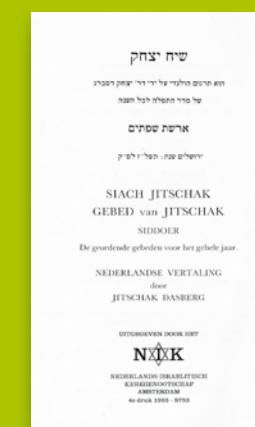
Titelblad Joods gebedenboek