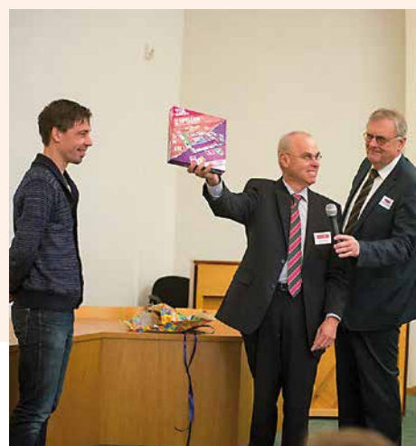
Overhandiging van het TUA-Kennisspel

voor onze aanwezigheid in Israël van grote betekenis. In de maand erna zullen docenten van de Christelijke Hogeschool Ede in Jeruzalem zijn voor een dergelijke studiereis, een paar maanden later weer een andere studentengroep uit Nederland. Telkens laten we zien hoe wij willen luisteren vanuit de verbondenheid die wij hebben met het Joodse volk. Door met regelmaat aanwezig te zijn groeit het besef bij de gesprekspartners van ds. Brons waarom wij dat graag willen. Op een natuurlijke manier kunnen we getuigen van wat er in ons hart leeft. Helaas bestaan er nog veel misverstanden over het getuigenis van het Nieuwe Testament. Het beeld van Jezus Christus is vaak enorm scheefgetrokken. Door onze houding en in onze woorden en daden wordt hopelijk iets van zijn liefde zichtbaar. Zo kunnen deze studiereizen naar twee kanten vruchtbaar zijn. <