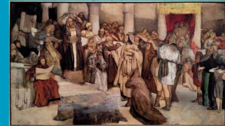
Christ before His Judges van Mauryc Gottlieb. Jezus is 'Joods' afgebeeld met gebedsmantel en bedekt hoofd.