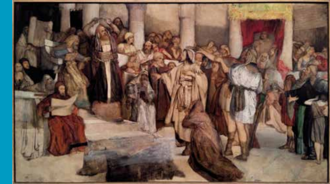
Christ before His Judges van Mauryc Gottlieb. Jezus is 'Joods' afgebeeld met gebedsmantel en bedekt hoofd.

Het Israel Museum is een begrip, het is Israëls nationaal museum. Als daar een expositie is over Jezus in Joodse kunst word je heel nieuwsgierig. Waar komt Jezus in Joodse kunst voor? Wat geeft het Museum weer, en hoe? Wie komen er kijken?