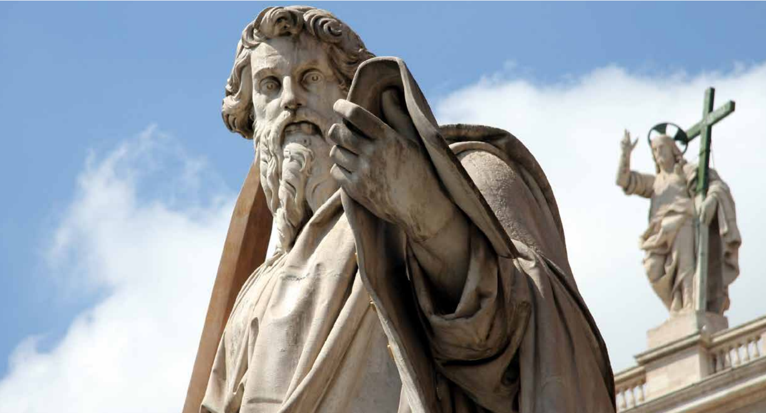
Paulus op de St. Pieter in Rome