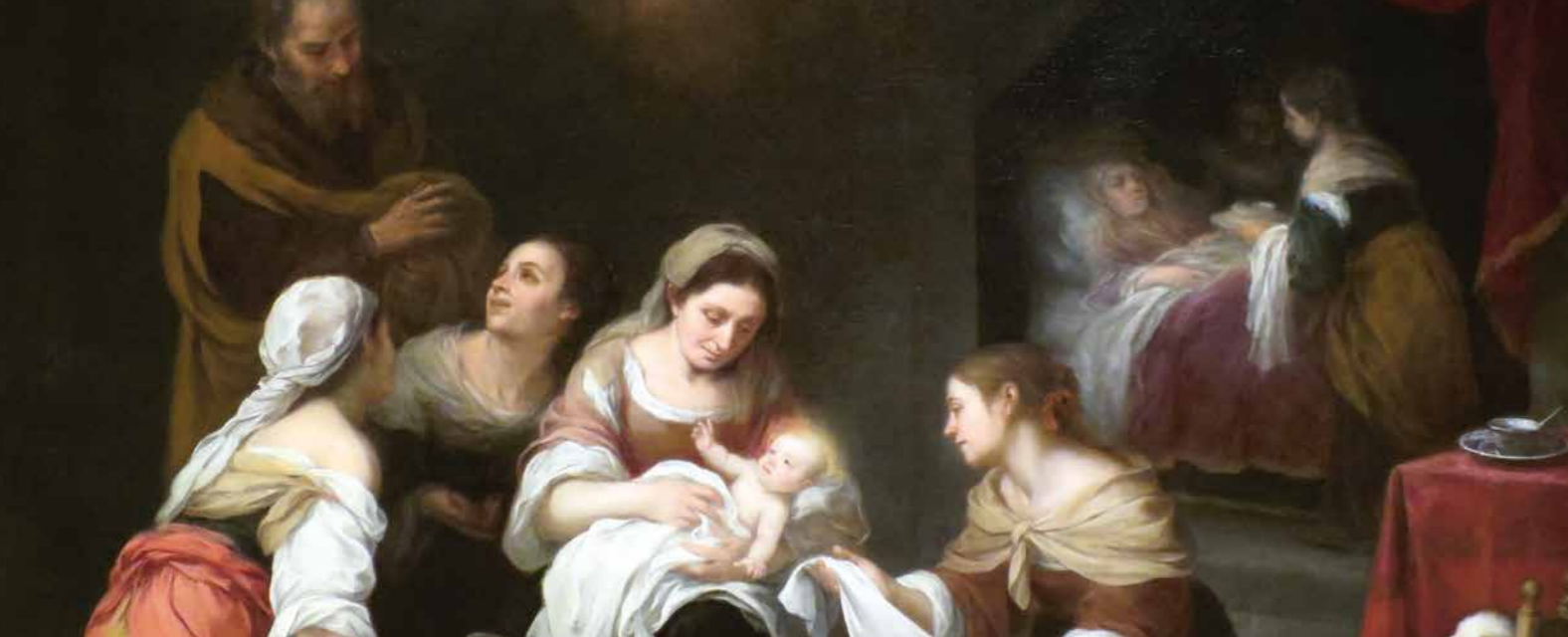
Bartolome Murillo, De geboorte van Johannes de Doper (ca. 1655)