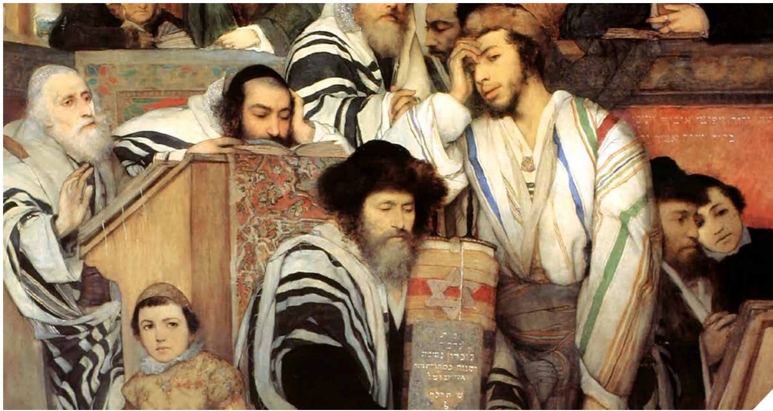
Schilderij Mauryc Gottlieb (1878).