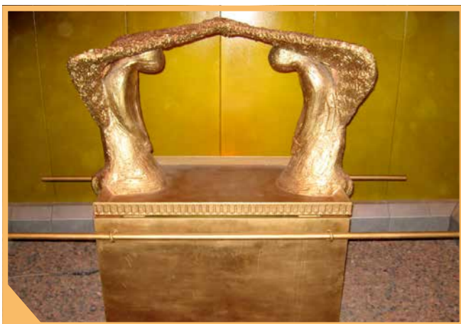
Replica van de tabernakel in de Negevwoestijn.

De indringende gebeden op Grote Verzoendag worden uitgesproken op een jaarlijks vastgestelde dag. Dat lijkt een open deur, maar het betekent dat de gebeden om vergeving en verzoening worden uitgesproken op een volgens de kalender bepaald tijdstip, niet op een moment dat iemand er behoefte aan voelt. Zo was het door God zelf al vastgesteld, zoals in Leviticus 16 te lezen is. Op die bepaalde dag zal het volk als geheel vragen om vergeving en verzoening. Het is een dag van reiniging, van opnieuw voor God staan als een zondig volk dat in de gebeden uitdrukking geeft aan de werkelijkheid van schuld en falen. Dit houdt in dat niet persoonlijke gevoelens leidend zijn, maar dat de Joodse bidder zich op die bijzondere dag voegt bij die werkelijkheid waaraan het ver-