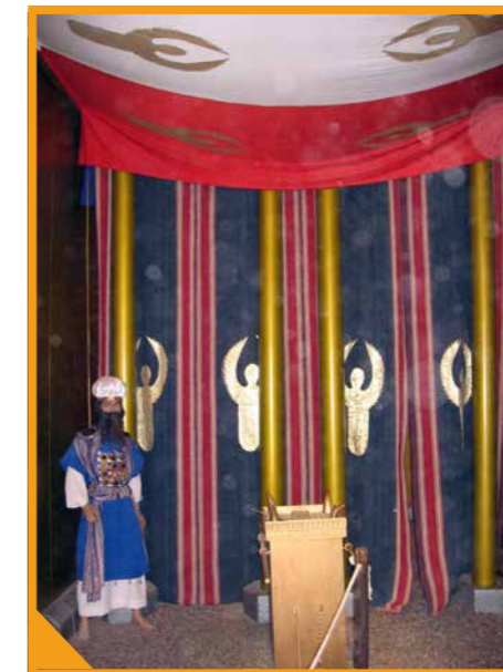
Replica van de tabernakel met het voorhangsel tussen het heilige en het heilige der heiligen in de Negevwoestijn.

De opdracht voor verootmoediging lezen we in Leviticus 16 vers 29 en 31 waar staat: 'Gij zult u verootmoedigen en generlei werk doen'. In de Bergrede noemt Jezus een drietal kenmerkende trekken van verootmoediging ter voorbereiding op Grote Verzoendag: bidden, vasten en het geven van aalmoezen (Matth. 5-6). Het is opmerkelijk dat binnen het Jodendom, zoals het zich na de verwoesting van de Tempel ontwikkeld heeft, dezelfde drie kenmerken worden genoemd: Torastudie, gebed en daden van barmhartigheid. De Torastudie omvat, nadat er door de verwoesting van de tempel geen bloedige offers meer gebracht worden, ook de offercultus in Leviticus en het vasten. Tegelijk wordt erop gewezen dat God levensheiliging belangrijker vindt dan het brengen van offers: 'want in liefde heb Ik behagen en niet in slachtoffers' (Hosea 6:6; Matth. 9:13, 12:7). Van de opdracht