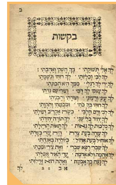
Bladzijde uit een joods gebedenboek.

Dichter in de buurt van de Joodse gebedspraktijk komen we als we het zingen van de psalmen en gezangen erbij betrekken. Veel liederen zijn vastgestelde teksten in de vorm van gebeden. We zingen ze samen. In ons zingen doen wij wat de synagoge doet in de gebeden. Het is daarbij wel opmerkelijk dat er – met uitzondering van de psalmen – weinig liederen zijn, waarin we uitvoerig zingen over zonde en schuld, vergeving en verzoening.