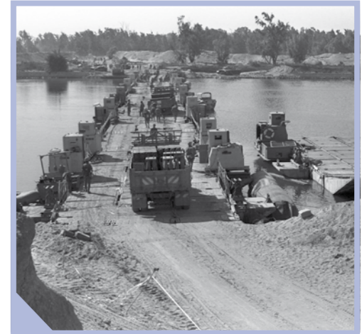
Een Israëlisch konvooi rijdt op 25 oktober 1973 over een brug naar de westelijke oever van het Suezkanaal.

Waarom deze vergissing? Israël verkeerde na de Zesdaagse Oorlog van 1967 in een overwinningsroes. Strategisch deskundige Shlomo Brom van het Instituut voor Nationale Veiligheidsstudies wijst erop dat minister Moshe Haim Shapira (Binnenlandse Zaken) zei: „We hebben hen verslagen en ze zullen zich in de komende jaren honderd keer afvragen of het de moeite waard is de strijd tegen ons te