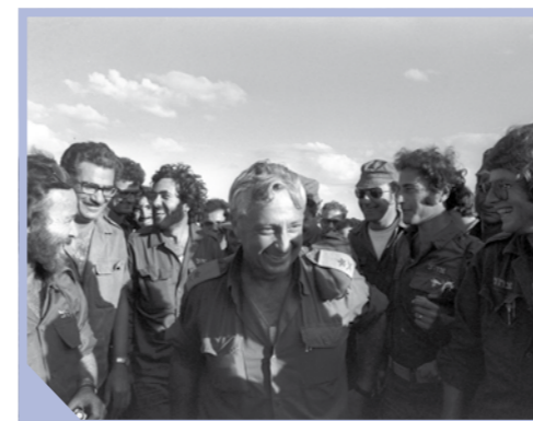
Generaal Ariel Sharon bezoekt zijn troepen op de westelijke oever van het Suezkanaal. Sharon was tijdens de oorlog het kanaal overgestoken en had zo het Egyptische leger omsingeld.