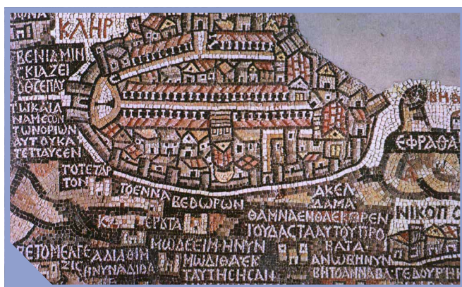
Jeruzalem en de heilige plaatsen rond 600 (Madaba-kaart; mozaïek kerk in Madaba, Jordanië)

Laten wij beginnen met het Nieuwe Testament. Daarin is maar heel weinig over het thema van het 'land' te vinden. Feitelijk is er maar één geschrift waarin het uitdrukkelijk