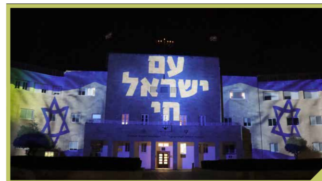
'Am Yisrael Chai': het volk Israël leeft

terug te zien in deze dodenaantallen. Wat verder opvalt op is dat men makkelijk voorbijgaat aan de afschuwelijke dingen die er gebeurd zijn op 7 oktober. De verhalen zijn zo gruwelijk dat het me vaak niet lukt om ze tot het einde uit te lezen.