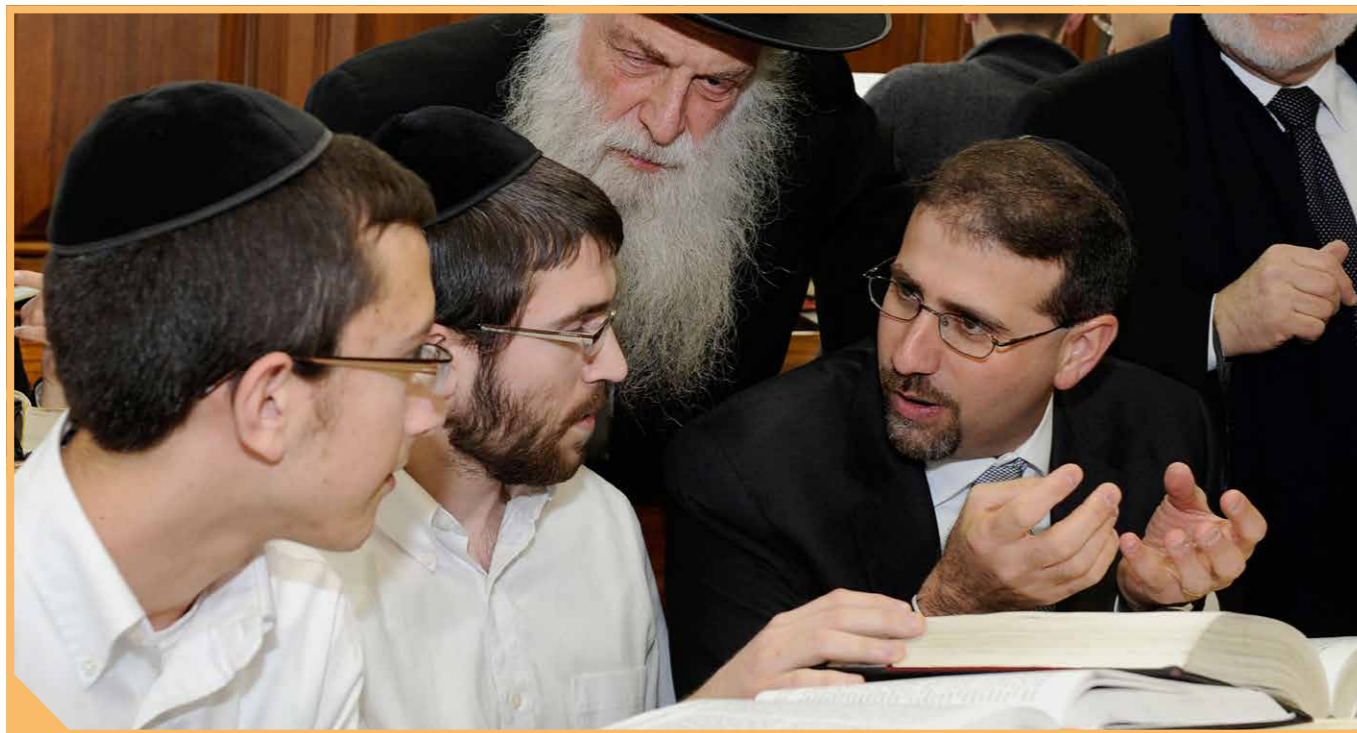
Het levende Israël

Uiteraard moet alles wat op deze studiedag gehoord en besproken is ook in de praktijk gebracht worden. Met dat doel wordt door de aanwezigen ten slotte Haggai 2:10 bestudeerd. Deze vruchtbare oefening maakt het belang van de centrale boodschap van deze dag nog eens extra duidelijk: Israël is een levende realiteit en dat hoort ook in de prediking door te klinken! «