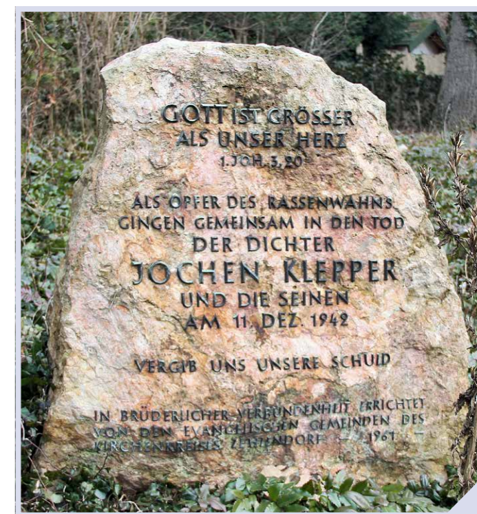
Gedenksteen van Jochen Klepper in Berlijn

Haat en onverschilligheid lijken te groeien in Nederland. Van open en respectvolle gesprekken lijkt steeds minder sprake, zeker niet online. "Wanneer je een andere mening hebt moet je kapot," schrijft Van Weezel in bovengenoemde column. "We zijn verleerd elkaar als mens te zien. Dat is niet alleen woestmakend. Eigenlijk is het vooral doodeng." Doodeng inderdaad. Waar moet je nog hoop uit putten? Die