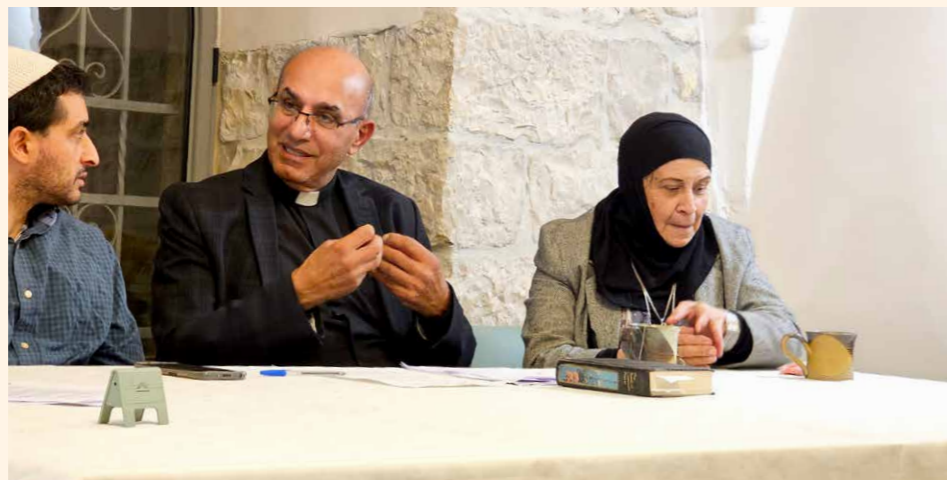
Ontmoeting van mensen van verschillende religieuze komaf