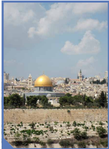
Bij de foto op de voorpagina:

De drie Schriftreligies hebben het land Israël en de stad Jeruzalem de eeuwen door beheerst. We zien het tempelplein waar de Joodse tempel gestaan heeft, de Omarmoskee waar de moslims bidden en de torens van de kerken waar christenen God loven. Het zijn godsdiensten die elkaar tot op de dag van vandaag 'in Gods naam' bestreden hebben, zoals de voormalige Britse opperrabbin Jonathan Sacks in zijn Niet in Gods naam beschrijft. Toch mag Jeruzalem de stad zijn die oproept tot vrede. Psalm 122:6-7 getuigt er van.