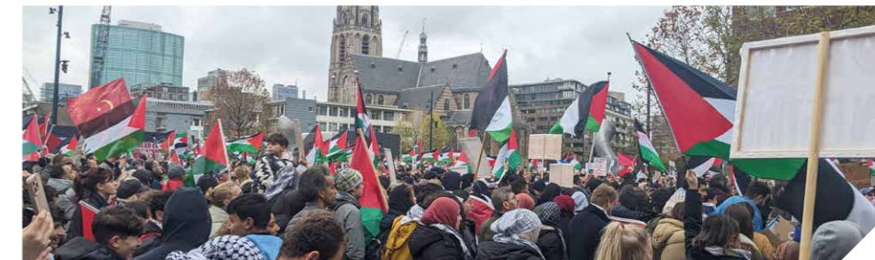
Samen voor Palestina-demonstratie, Rotterdam 19 november 2023 (Wikimedia, Donald Trung Quoc Don)

Want dat het Israëlische leger keihard zou terugslaan, was te voorspellen. Sinds de oprichting van de Joodse staat in 1948 heeft Israël aan alle vijanden steeds duidelijk gemaakt: na de Holocaust laten wij ons niet nog eens met uitroeiing bedreigen; wij zullen ons verdedigen tot onze laatste adem!