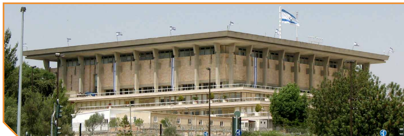
Parlementsgebouw de Knesset.

We mogen uitkijken naar een herstel van de schepping en een rijk van vrede en gerechtigheid op aarde. In het licht van die verwachting kunnen we ons met veel Joden verheugen over hun terugkeer naar hun thuisland, en tegelijk kritisch zijn op de politiek van Israël (en van Nederland en andere staten) waar een regering handelt op een wijze die haaks staat op dat komende rijk. «