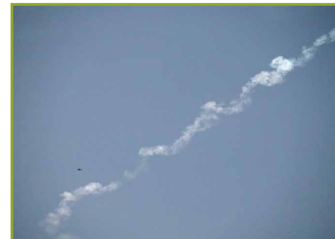
Rook van een inkomende raket.