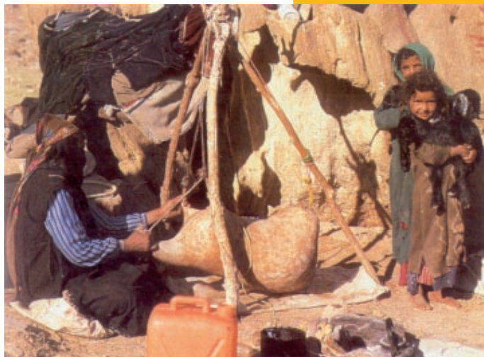
Een bedoeïenenvrouw bezig met een zak van dierenhuid

De schare heeft het opgemerkt: “Wat is dit? Een nieuwe leer met gezag!” (Markus 1:27) Waarbij het nieuwe enerzijds is zijn leer, als gezaghebbende, en niet als de schriftgeleerden (1:22); anderzijds, dat Jezus ook metterdaad heelt, met gezag ook over de boze geesten