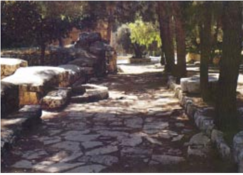
Deel van de oude Romeinse weg vanuit Jeruzalem naar het westen: richting Emmaüs?