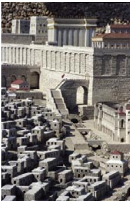
Maquette van Jeruzalem ten tijde van Jezus. Een stukje van de stad, met midden boven de tempel; linksboven torens van de burcht Antonia.

Van de woonplaats Jeruzalem zegt Jezus dat zij 'aan u overgelaten wordt'. Het woord dat met overlaten is weergegeven