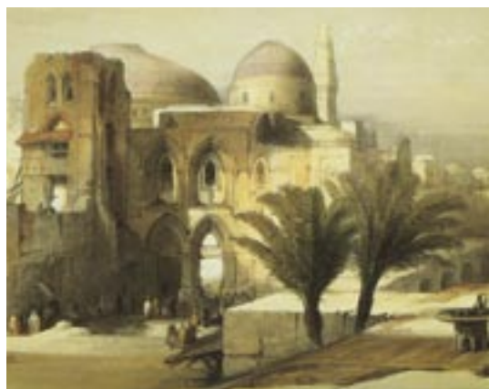
De Grafkerk in de tijd van David Roberts

In die mis moest vaak een eerste obstakel weg worden genomen. Om naar Jeruzalem te mogen reizen had een pelgrim