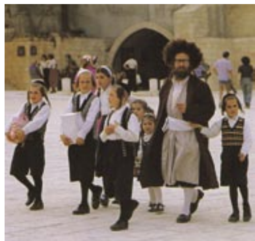
De slip van een joodse man vastgrijpen

De profeet wil met deze prediking van Gods heil dat voor Israël aanstaande is, het volk bemoedigen.