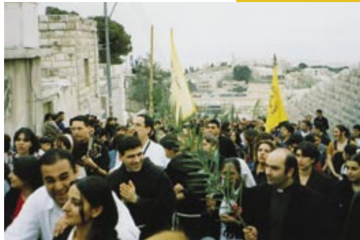
Gelovigen uit de volken gaan op Palmzondag op naar Jeruzalem

En deze belofte van Gods heil in Jezus Messias geldt voor Israël nog altijd