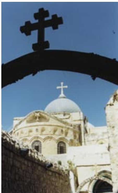
De Graf- of Opstandingskerk te Jeruzalem

druk zijn in de Heilige Grafkerk met alle pelgrims die daar samengekomen waren. Zij kwamen daar om te bidden en de heilige plekken in de immense kerk te bezoeken. Overdag verlieten de pelgrims de kerk om door de franciscanen in rap tempo langs alle heilige plaatsen van Jeruzalem te worden gevoerd. Er werd dan voornamelijk de omgekeerde kruisroute gelopen: vanaf Golgota (in de Heilige Grafkerk) terug naar de plek van het Laatste Avondmaal. Bij elke bezienswaardigheid werd kort aangeduid wat daar te zien was, aangevuld met verwijzingen naar de bijbel, waarbij de Joden vaak een negatievere rol werd toegedicht dan zij daadwerkelijk hadden gespeeld. 's Nachts gingen zij dan weer de kerk in om daar opnieuw te bidden en dat herhaalde zich nogmaals. Vervolgens werd in enkele dagen de ruime omgeving van Jeruzalem