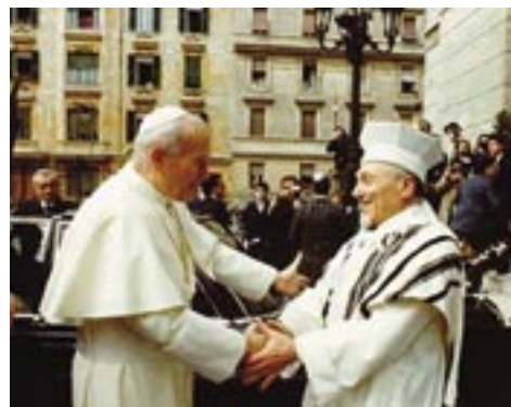
Paus Johannes Paulus II ontmoet de Opperrabbijn van Italië in 1986

De actualiteit van deze problemen moge blijken uit o.a. een tweetal geschriften. Het eerste is uit 2001