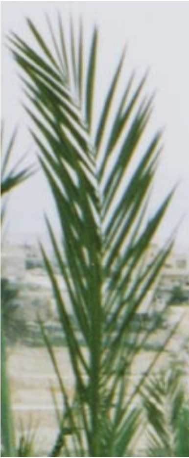
De palmtak, symbool voor een pelgrimage naar Jeruzalem

zij in het Heilige Land eigenlijk de weg? Allerlei vragen die de moderne mens doen denken dat de reis naar Jeruzalem voor een middeleeuwer vrijwel ondoenlijk geweest moet zijn.