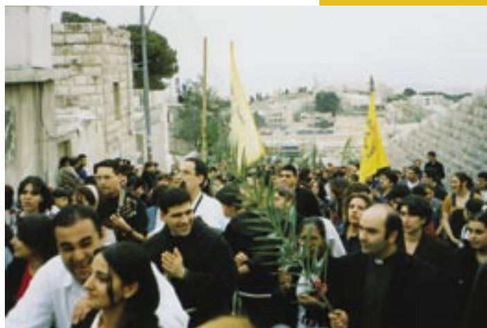
Gelovigen uit de volken gaan op Palmzondag op naar Jeruzalem

En deze belofte van Gods heil in Jezus Messias geldt voor Israël nog altijd