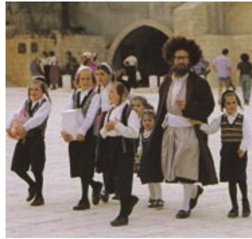
De slip van een joodse man vastgrijpen

De profeet wil met deze prediking van Gods heil dat voor Israël aanstaande is, het volk bemoedigen.