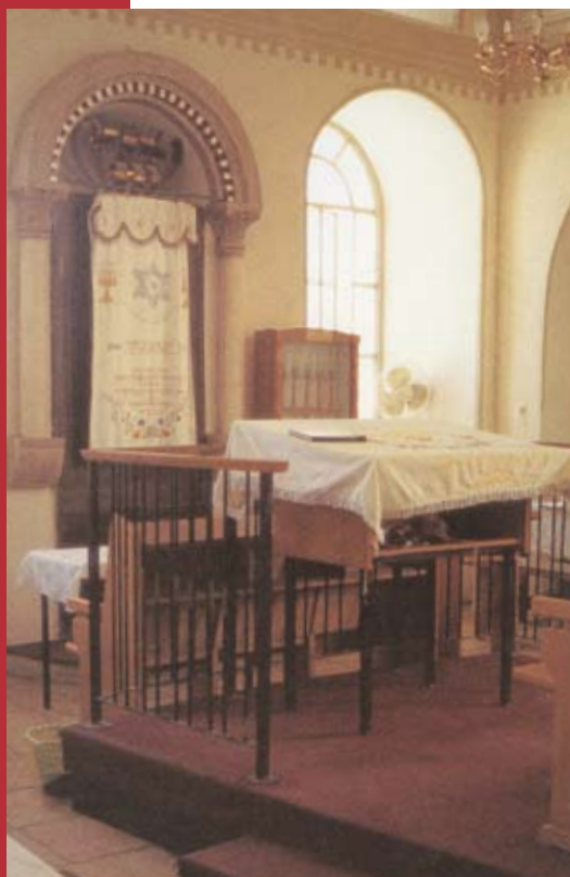
Een synagoge in Jeruzalem. Israël toch subject van zending.

aangetekend dat nadrukkelijk een ontmoeting met heel Israël bedoeld wordt. Naast Messiasbelijdende Joden komen daarbij ook religieuze en seculiere Joden in het vizier. Ter nadere adstructie zijn drie kernwoorden toegevoegd, namelijk luisteren , dienen en getuigen . Bij elk van deze kernwoorden plaats ik een enkele opmerking.