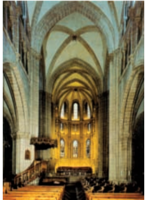
Interieur van St. Pierre, de kathedraal waarin Calvijn voorging

Zou God van zijn kant, vanwege de ongehoorzaamheid van de mens, het verbond verbreken, dan zou het heil niet alleen voor Israël, maar ook voor ons, op losse schroeven komen te staan.