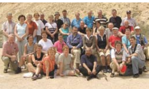
Groepsreis Israël 2006