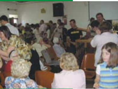
De overvolle kerkzaal

Veel verschillen vielen ons op: de inhoud van de dienst, de invloed van de voorganger, de invulling vanuit de joodse traditie