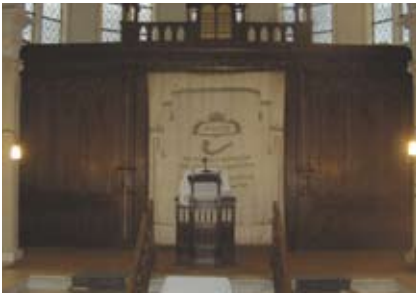
Ark met kandelaren

gemeenschappelijke matseiwah /grafzerk geplaatst voor alle Zwolse Joden, omgekomen in de Duitse vernietigingskampen 1940-1945.