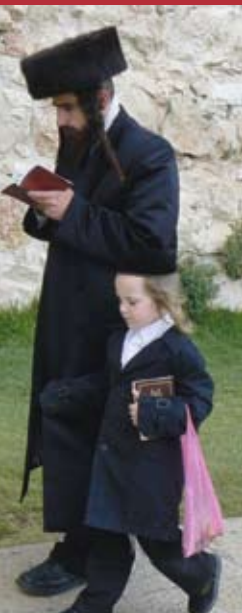
Man met streimel en zwarte zijden jas