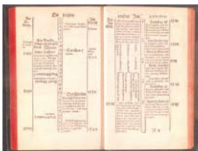
Illustratie van Luthers eindtijdsverwachting

Conclusie: Luther was anti-judaïstisch van meet af aan