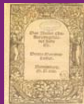
Titelblad van het Jodenvriendelijk boek van Luther

in ziet, voor eeuwig niet.' Hij scherpt het nog aan met de woorden: 'Hun synagogen moet men in brand steken