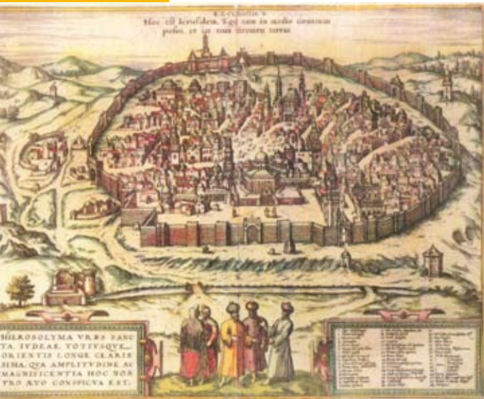
Kopergravure Jeruzalem de Heilige stad: 'Uit Sion zal de wet uitgaan' Jes. 2:3

Joden mogen nu wervende getuigen zijn voor de gekomen Koning-Mes- sias, Jezus Christus