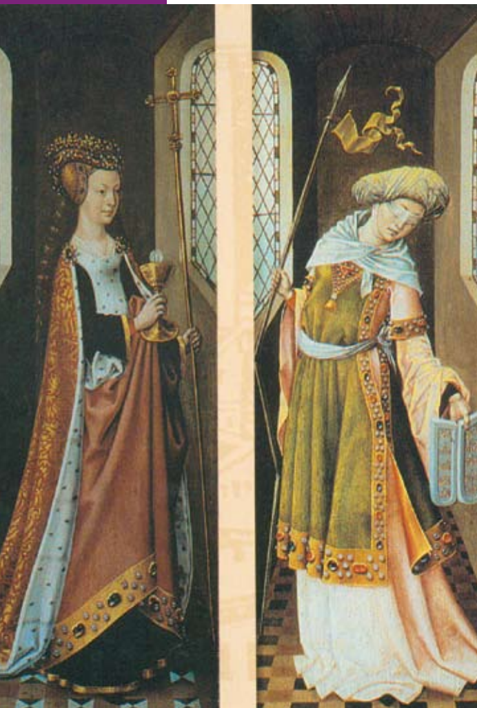
De ziende kerk en de blinde synagoge

Zeker, binnen de kerk, vooral bij de Puriteinen, in de kring van de Nadere Reformatie en van het Reveil, kon men andere geluiden horen. Daar speelde Romeinen 11 bij velen een beslissende rol. God zou vasthouden aan de verkiezing van zijn volk en het op zijn tijd laten terugkeren naar het land. Vanuit die visie zou terugkeer niets minder zijn dan een teken van Gods trouw aan Israël. Deze visie kwam sterk overeen met de blijvende hoop van Israël zelf.