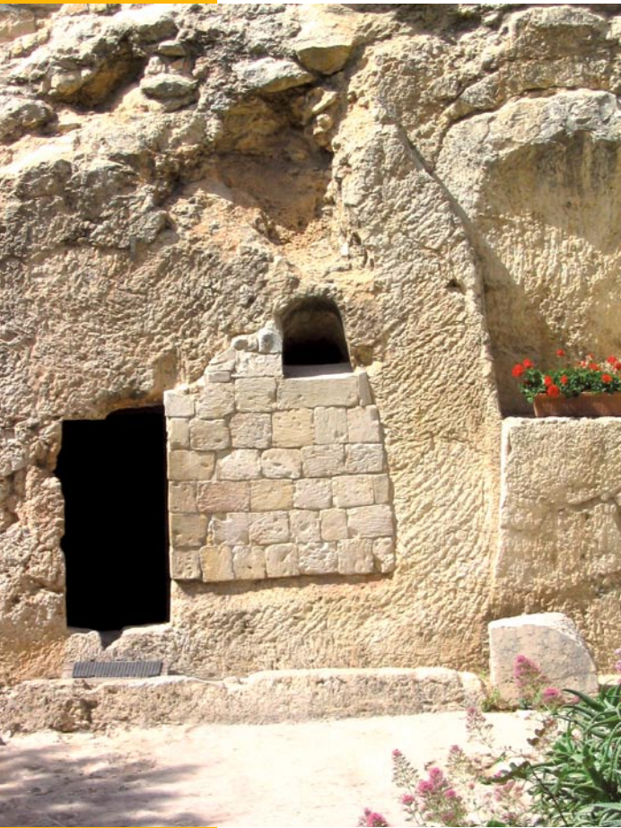
Open graf: Psalm 16 als getuigenis van de opstanding

(tabernakel)dienst voor de Here, geen eigen grondbezit. Het erfdeel van Levi was de HERE. Anders gezegd: de HERE zou Zelf, zij het door de dienst en de gaven van de andere stammen, voor Levi en diens bestaansmogelijkheid en onderhoud zorgen.