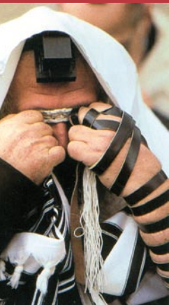
Joodse man in gebed

als de grote gebedsmantel. Er zijn twee gebedsriemen: de ene wordt om het hoofd gedragen de andere om de linkerarm. In beide gevallen is precies beschreven hoe ze moeten worden aangelegd en hoe ze eruit zien. De eerste riem wordt in de nek samengebonden en hangt dan langs de rug naar beneden. Op het voorhoofd zit een klein zwart doosje of 'huisje': het ziet er een beetje uit als plastic, maar is van leer gemaakt. De andere riem heeft ook zo'n doosje: het zit aan de binnenkant van de bovenarm, vlak bij het hart. De riem wordt om de arm gebonden, zeven keer om de onderarm en ook om de hand gewikkeld en vastgehouden met de vingers. Het gaat hier om deze doosjes, want daar zitten teksten in, precies vastgelegd en geschreven op perkament. Belangrijk is Deuteronomium 6, met onder andere de woorden: 'Gij zult het (nl. wat ik u heden gebied) ook tot een teken op uw hand binden en het zal u een voorhoofdsband tussen uw ogen zijn'. Duidelijk is, dat hier ook weer een bijbels gebod vervuld wordt. Misschien voor ons op een wat verrassende manier, maar hoe zul je de woorden anders aan je hand en tussen je ogen bevestigen?