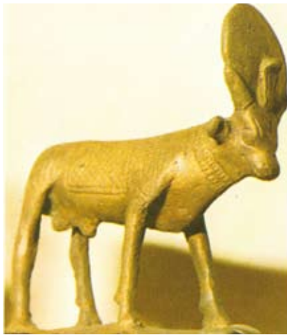
Het rund Apis, het Egyptische gouden kalf waaromheen Israël danste bij Sinaï.

Zo kom je bijvoorbeeld allerlei wetten tegen op het gebied van de seksuele moraal. Dat is een praktisch protest tegen de manier waarop de Kanaänieten