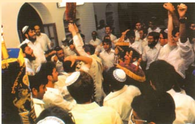
Met Israël de vreugde der wet beleven.

Biedt dit niet een invalshoek voor het gesprek met Israël? Dat we allereerst kijken naar: wat hebben we gemeenschappelijk? Waar gaan we voor? Kunnen we misschien gezamenlijk iets van Vreugde der Wet meemaken? Om dan gezamenlijk eens te kijken wat ieders drijfveren zijn? Daar aangekomen, zou het gesprek wel eens extra spannend kunnen worden. Als we dan met Israël Vreugde der Wet maar niet vergeten.