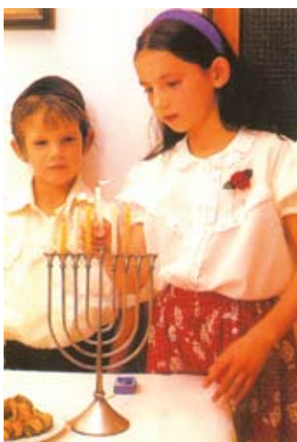
Kinderen ontsteken de Chanoekakandelelaar

De meeste messiaanse gemeenten, zo laat Van de Poll zien, vieren naast sjabbat de voornaamste joodse feesten: Pesach, Jom Kippoer, Soekkot, Chanoeka en Poeriem. Voor de gemeentes in Israël hoort dat gewoon bij de Israëliëse samenleving, voor de gemeentes in Amerika en Europa is dat een welbewuste keuze. Zij willen de joodse feesten vieren in plaats van de christelijke, om zo duidelijk te maken dat men onderdeel wil zijn van de bredere joodse gemeenschap. Ondertussen blijven die feesten niet hetzelfde.