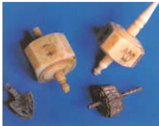
Dreidels; de dreidel is een toltetje waarmee kinderen spelen op het Chanoeka-feest. Op het toltetje staan vier letters, die staan voor de Hebreeuwse zin: ‘Daar is een groot wonder geschied’.

Wat voor beeld rijst er uit het boek van Van de Poll nu op van het ‘messiaanse jodendom’? Het is duidelijk een beweging die nog op zoek is naar zijn identiteit. Er is sprake van behoorlijk uiteenlopende ideeën en vrijwel niet een gemeente lijkt op een andere. In de keuze om de joodse en niet de christelijke feesten te vieren ligt echter duidelijk een punt van eenheid tussen al die gemeenten. Een eigen theologie is ook nog sterk in ontwikkeling. Er zijn enkele leidende theologen, die christelijke theologie en joodse traditie proberen te verbinden, en hun stem wint langzaam aan invloed in de beweging. Wat opval-