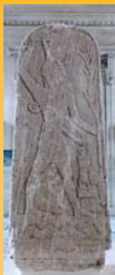
De vruchtbaarheidsgod Baäl, die vereerd werd in Kanaän.

met leven in vrijheid te maken. Het gaat niet om plagerijen, maar om optimale ruimte voor het menselijk leven voor het aangezicht van God. Er is geen andere God dan de HERE. Er is ook geen leven buiten de relatie met de HERE. En die relatie wordt beleefd door te wandelen in de tuin van zijn geboden; zijn geboden die goed zijn voor het leven van mensen.