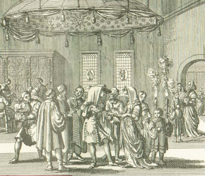
De weergave van een Joodse Bruiloft door Jan Luyken, 17e eeuw