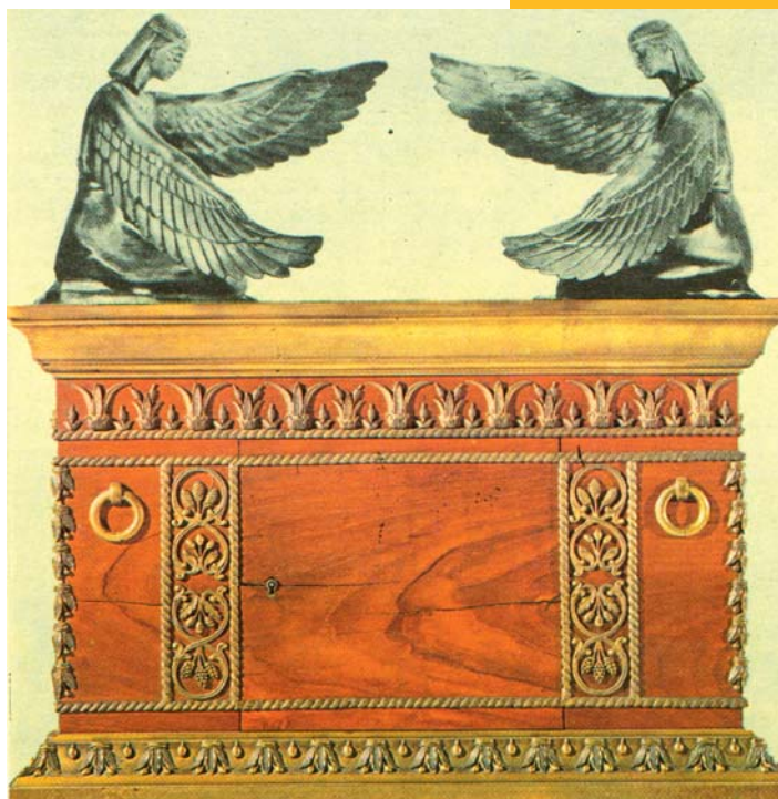
De ark van het verbond met het verzoendeksel

op de Thora. Ook het onderscheid tussen Pasen, het in relatie treden tot God, en Grote Verzoendag, het herstel van de geschonden relatie, is in het Nieuwe Testament gehandhaafd. Het echt beslissende onderscheid is de erkenning van Jezus als de door God geschonken Messias. De schrijver van de brief aan de Hebreeëen zegt daarvan: Nadat God eertijds vele malen en op vele wijzen tot de vaderen gesproken had in de profeten, heeft Hij nu in het laatst der dagen tot ons gesproken in de Zoon. (Hebr. 1:1). In Hem schenkt de God van Israël verlossing en verzoening. Daar ligt tot op de dag van vandaag een groot spanningsveld. Een spanningsveld dat stellig vergroot is door de doorgaans negatieve houding van de kerk t.o.v. de Joden in de loop der eeuwen. In het heden is dit zeker een van de elementen die het voor Joden moeilijk maken Jezus als Messias te erkennen. Bekijken we de moeite daartoe vanuit het thema verzoening, dan komt daar nog dit bij. In de Tenach wordt de Messias doorgaans wel getekend als Bevrijder, maar niet direct als iemand door wie verzoening tot stond gebracht wordt. Een beroep door christenen op Jesaja 53, de profetie over de lijdende knecht des Heren, wordt daarom meestal van joodse zijde van de hand gewezen. Toch geeft deze profetie stellig een indirecte aanwijzing. Jesaja gebruikt niet het woord Messias, maar heeft het over 'de rechtvaardige': door zijn kennis zal mijn knecht, de rechtvaardige, velen rechtvaardig maken (Jes. 53:11). Nu