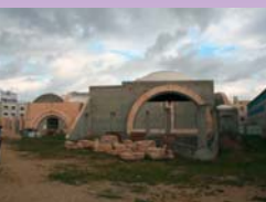
Het kerkgebouw in aanbouw

Veel hebben we geleerd in deze week. Veel goede gesprekken hebben we gehad, maar bovenal danken we onze hemelse Vader die harten en deuren opende. Vol vertrouwen gaan we een gezamenlijke toekomst in.