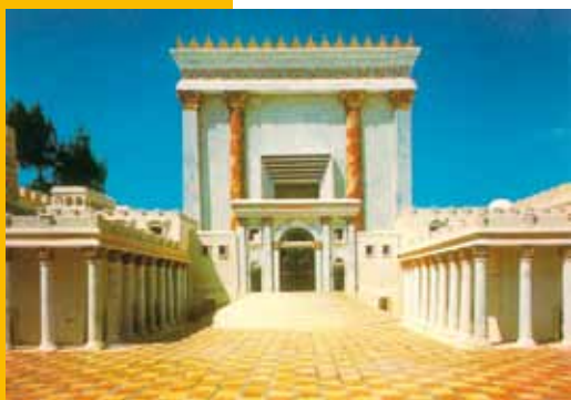
Maquette van de Tweede Tempel in Jeruzalem

heidene besneden worden. Deze Farizeeën erkennen Jezus als Redder. Voor hen is de vraag in het geding: Hoe kan er anders een geheiligd leven zijn? Heeft God daarvoor niet het verbond gegeven, waarvan de besnijdenis de entree is en de wet van Mozes de levenspraktijk? Ook gelovig geworden Joden blijven zich houden aan de wet van Mozes, inclusief reinheidswetten en spijswetten. Maar hoe kunnen zij trouw blijven aan het verbond als medegelovigen uit de volken met wie zij omgaan zich niet aan de code van het verbond houden? Dit is het spanningsveld waaraan Petrus zich volgens Paulus in Galaten 2 heeft vertild. Hij at eerst wel met de gelovig geworden heidenen aan één tafel, maar zag er later van af. De oplossing is volgens de Farizeese gelovigen: ook heidense volgelingen van Jezus moeten zich laten opnemen in het verbond en hun leven afstemmen op de woorden van het verbond. Dan is samen eten en Avondmaal vieren geen probleem meer.