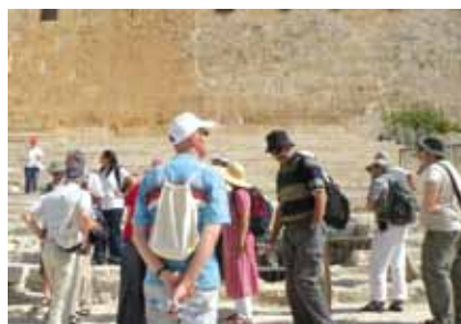
Eeuwenoude trappen in Jeruzalem

Kern van de reis was een driedaagse conferentie in Jeruzalem