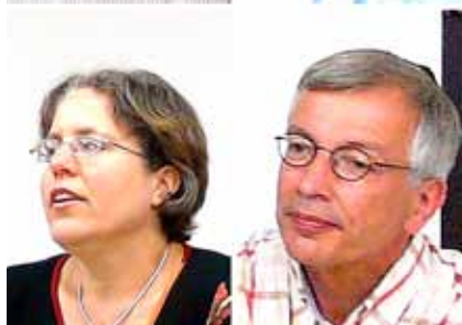
De sprekers tijdens de conferentie