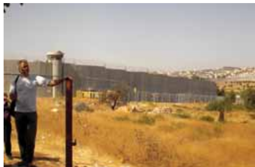
De muur die Bethlehem afscheidt van Jeruuzalem

In drie dagen tijd zijn we, zo bleek, dichtbij elkaar gekomen. We hebben iets beleefd van verbondenheid met elkaar. We kregen een kans, die je niet zo vaak krijgt, om echt met elkaar in gesprek te zijn.