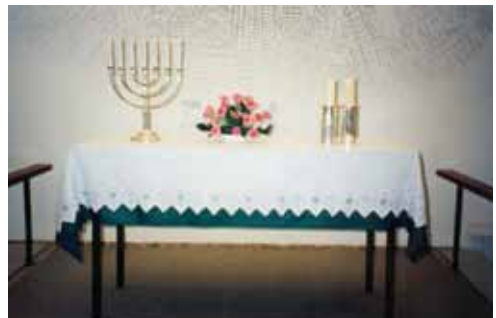
De Messiaanse gemeente Beit Eliahu te Haifa