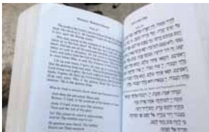
De Siddeor: het gebedenboek

sloten goed aan bij de herdenking in het Jodendom op de 9e Av (20 juli) van de verwoesting van de tweede tempel. Het was een mooi moment waarin we enigszins inzicht kregen in de praktijk van het geloof van de twee tradities. Dat kregen wij als deelnemers aan de reis ook tijdens de ochtendwijding op het instituut. We mochten er meelesen uit het gebedenboek, de Siddeor .