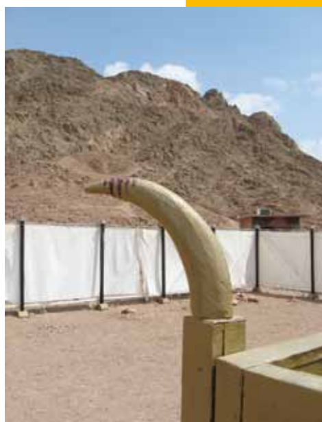
Een van de vier hoornen van het brandofferaltaar

Joden kunnen geen offers meer brengen op de manier zoals in Leviticus wordt beschreven. Ze wachten bij wijze van spreken op de herbouw van de tempel. Maar ze lezen Leviticus wel, en