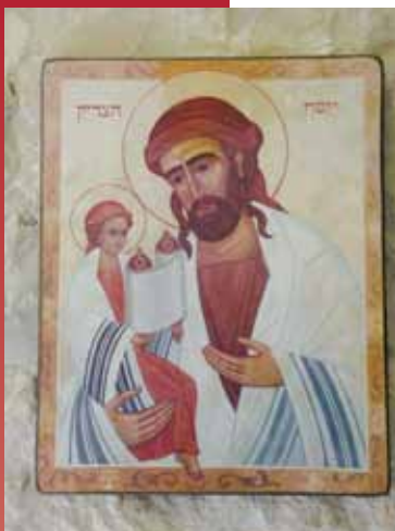
Icoon in de Kerk van de Zaligsprekingen nabij Latrun

Dat neemt niet weg dat ik steeds weer ontdekte hoe groot de kloof tussen Jezus en het Joodse volk is