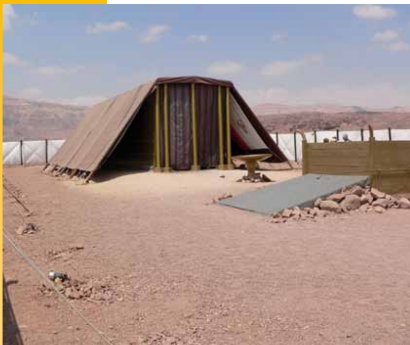
tabernakel, koperen wasvat en brandofferaltair

ze zoeken in praktijk te brengen waar het in het boek Leviticus ten diepste om gaat: de omgang met de Here God. Christenen brengen ook geen offers meer op de manier zoals beschreven in Leviticus. Ze hebben genoeg aan het ene offer van Jezus Christus op Golgotha. Sindsdien lezen ze Leviticus niet of nauwelijks meer. Dat is wel opmerkelijk. Misschien hebben ze elkaar wel nodig. Joden zouden christenen kunnen leren om Leviticus weer te lezen. Het zou wel eens verhelderend kunnen zijn voor het verstaan van het offer van Christus. En christenen zouden, al lezend uit Leviticus, iets kunnen zeggen van Christus en zijn offer. Dat is echte dialoog.