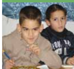
Twee jongetjes in een school in Oost-Jeruzalem (1800 leerlingen)