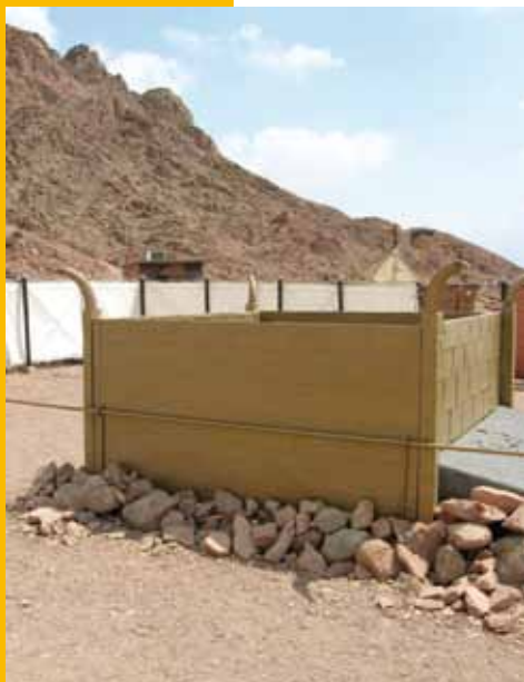
Het koperkleurige brandofferaltaar

God roept, Hij heeft het eerste woord. En dan pas komen wij