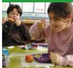
Kinderen in de klas nuttigen hun maaltijd

Naast deze drie lessen opent de diaconale invalshoek onze ogen steeds weer voor de concrete realiteit van het volk Israël. We zijn op een bijzondere wijze met Israël verbonden, maar we willen en kunnen niet voorbij gaan aan het feit dat er in Israël ook andere volkeren wonen. Zonder de complexiteit en de spanning die dit met zich meebrengt te bagateliseren, geloven we dat ook zij recht op bestaan hebben en geholpen dienen te worden in hun noden. Het zijn vooral de Arabische en Palestijnse christenen die ons aan deze opdracht herinneren. Als we over diaconale presentie in Israël spreken, hanteren we dus een dubbele focus: we zijn verbonden met Israël, maar van daaruit ook met andere volken. Tegelijk zien we dat er in en vanuit Israël initiatieven zijn die deze evenwichtigheid in zich dragen. Zou het daarom niet krachtig zijn als we juist als kerk daarvoor alle ruimte bieden? 'Kerken helpen het Joodse volk om gerechtigheid en barmhartigheid te doen', zou dan een passende definitie van diaconale presentie in Israël kunnen zijn.