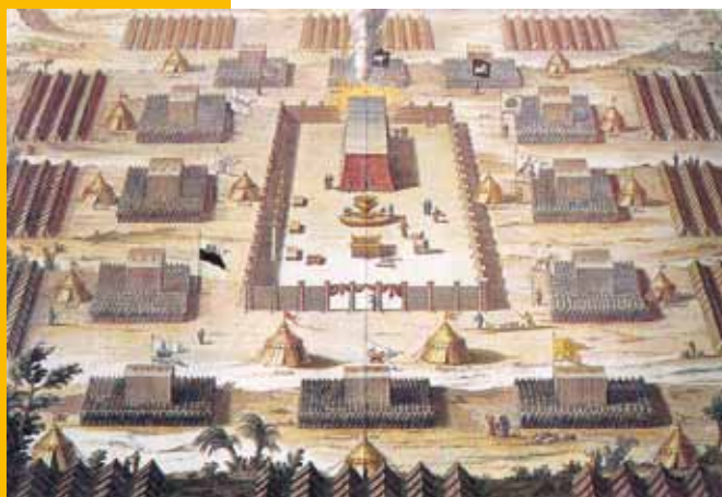
Het volk Israël gelegerd rondom de tabernakel aan de voet van de berg Sinai

Met Avraham ontstond er onderscheid tussen de G-ddelijke geboden voor de hele mensheid en de extra geboden voor de afstamme- lingen van Avraham