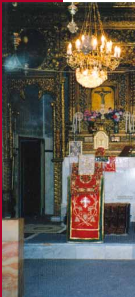
De St. Marcuskerk, nu het middelpunt van de Syrisch-orthodoxe of Jacobiëngemeenschap

Het is mondelinge Tora, die later is ontstaan, als uitwerking van het Bijbelse verhaal