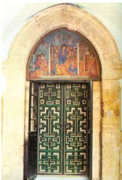
St Marcuskerk te Jeruzalem. Volgens een traditie kwam op deze plek de eerste gemeente samen

'Gezegend U, Eeuwige onze God, Koning der wereld, die ons door zijn geboden een bijzondere taak hebt opgelegd ...' Men telt 613 geboden. Voor niet-Joden verwijst het Jodendom naar het verbond van de Eeuwige met Noach en zijn zonen (Gen. 9). De rabbijnse traditie ziet daar een aantal universele leefregels gegeven. In de regel telt men er zeven: een gebod tot rechtspreken, en verboden op afgodendienst, moord, ontucht, godslastering, diefstal en het eten van een deel van een levend dier.