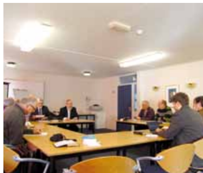
Deputaten Kerk & Israël tijdens de bezinningsbijeenkomst

Het gaat in Handelingen 15 dus niet om ethiek of manier van leven, maar om reinheid, tafelmanieren