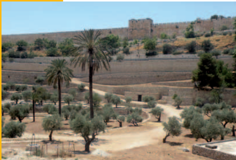
De Gouden Poort vanuit het Kedrondal