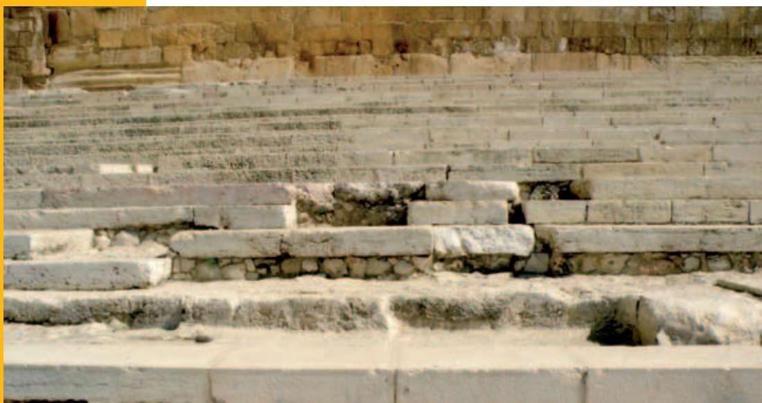
Trappen naar Jeruzalem

Hierdoor alleen al beleven we de Psalmen op een heel andere manier dan Gods volk ten tijde van het Oude Testament. Vooral ouderen kennen hun geliefde verzen uit de Psalmen, verzen die iets gedaan hebben op belangrijke momenten in hun leven.