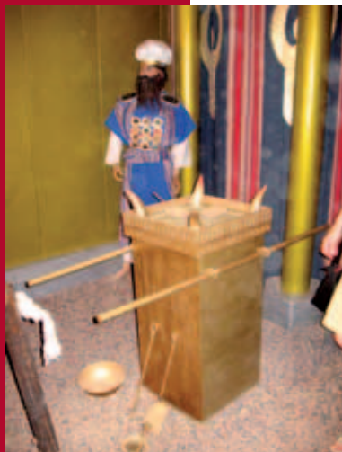
Het gebed als reukoffer voor Gods Aangezicht is gebleven.

aan God in de studie van de Thora, de gebeden en het doen van barmhartigheid. In feite ligt hier een belangrijke reden dat het Jodendom na de verwoesting van de tempel theologisch – als Jodendom – kon overleven, omdat er binnen de stroming van de Farizeeën al belangrijke aanzetten waren gegeven,