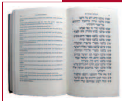
Gebed uit een Joods gebedenboek. De gebeden hebben de functie van de offerdienst overgenomen.

Verwondering van Joodse zijde dat het ene offer van Jezus de vele offers kan vervangen