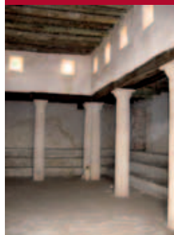
Replica van de synagoge die aan het begin van de jaartelling op Massada heeft bestaan.

Een derde reactie op de verwoesting van de tempel is de alternatieve dienst