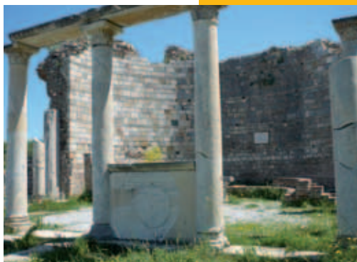
Tekens van christelijk leven in Efeze, de maagd Mariakerk