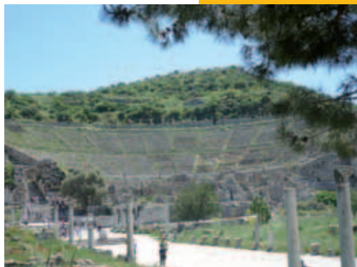
Een theater te Efeze