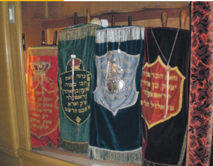
Thora-rollen in de Ark van de synagoge in Aalten

De Tien Geboden maken deel uit van het geheel, dat geheel, waarvan Jezus zegt dat Hij niet gekomen is om het te ontbinden maar te vervullen