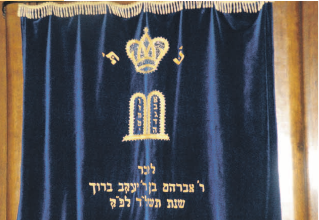
De Ark van de kleine sjoel in de synagoge van Enschede

Wat betekent het doen van de wet voor de leerlingen van Jezus? Daar geeft Jezus voorbeelden van in de verzen 21, 27, 31, 33, 38 en 43. Het gaat daarin over doodslaan, echtbreken, echtscheiding, de eed, wraak, liefde tot zelfs je vijanden. Vers 48 rondt het gedeelte af met de woorden: 'Gij dan zult volmaakt zijn, gelijk uw hemelse Vader volmaakt is.' Horen en doen mogen geen twee heel verschillende dingen zijn, maar moeten één zijn. Dat is de essentie van het doen van Gods wil.