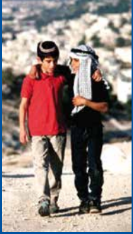
Een Joods en een Palestijns jongetje als vrienden samen

Nederlanders zijn kritischer over Israël dan zo'n 15 jaar geleden