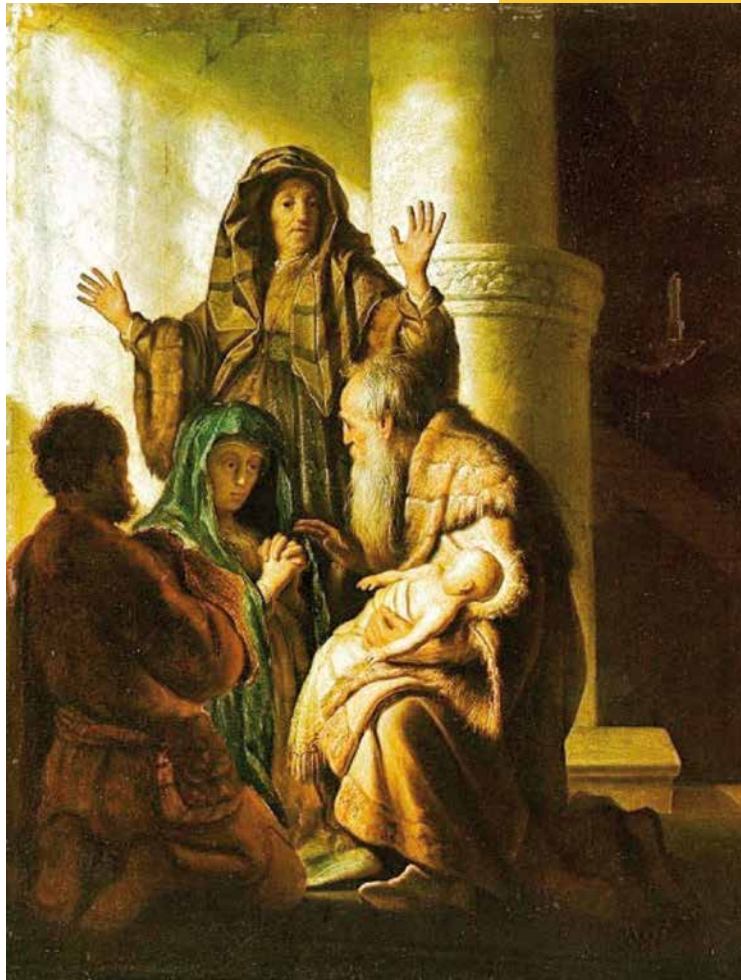
Rembrandt: Simeon en Hanna bij Jezus en Maria

Hem tot stand gebracht, al moeten we daarbij niet vergeten, en dat zegt Simeon ook in het vervolg, dat het door de crisis heen zal gaan. Intussen is het opvallend, dat hier alle volken ter sprake komen. Als je afgaat op de woorden 'laos' en 'ethnos' vindt er een merkwaardige verschuiving plaats. De ontsluiting van de heidenvolken, en