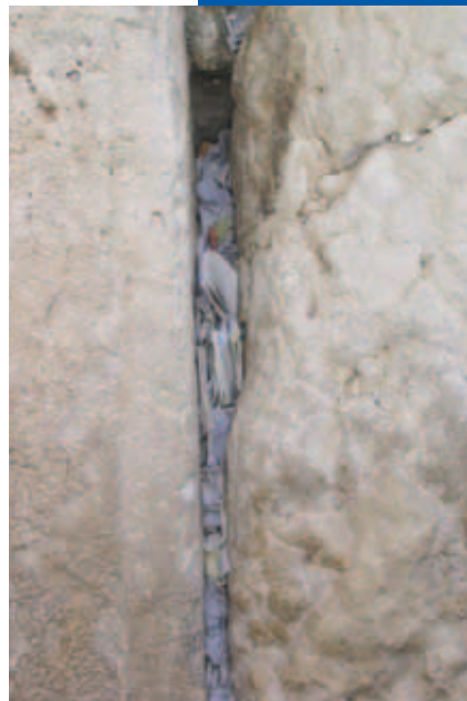
Een spleet in de Westelijke Muur met gebedsbriefjes om vrede

Deze eigenlijk nog kleine dingen houden óns al erg bezig – maar hoe moet het dan zijn voor de mensen die in de buurt van de Gazastrook wonen, en voor de soldaten die daar gelegerd zijn. Wat wij vooral van meer nabij meemaken is de bezorgdheid van moeders en vaders over hun kinderen die wonen in gebieden die constant bestookt worden, of die daar