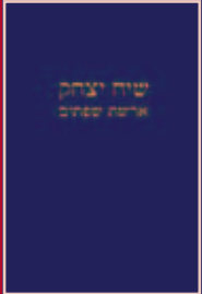
De sidder in de Nederlandse vertaling