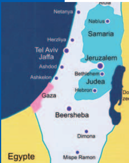
Israël en de Palestijnse gebieden

in dienst zijn (en met wie dan beperkt contact mogelijk is). We horen van mensen die om de haverklap naar de schuilkelder moeten, die geen nacht door kunnen slapen. De laatste keer: