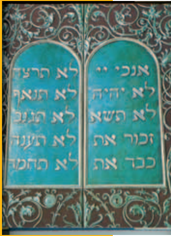
De tafels van de wet met de Tien Woorden