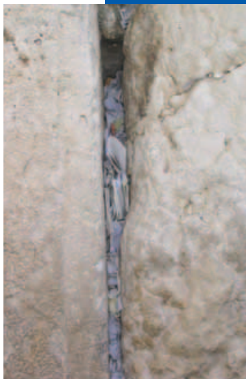
Een spleet in de Westelijke Muur met gebedsbriefjes om vrede

Deze eigenlijk nog kleine dingen houden óns al erg bezig – maar hoe moet het dan zijn voor de mensen die in de buurt van de Gazastrook wonen, en voor de soldaten die daar gelegerd zijn. Wat wij vooral van meer nabij meemaken is de bezorgdheid van moeders en vaders over hun kinderen die wonen in gebieden die constant bestookt worden, of die daar